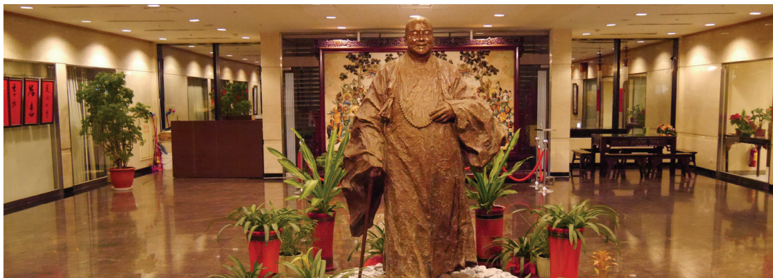
蘭陽別院 - 一樓大廳

也不負大師對我們的期望，真是「讓人人藉著對佛的崇敬禮拜，而提昇自我、開發自我、以覺性的啟發，來面對每一天的生活。」。