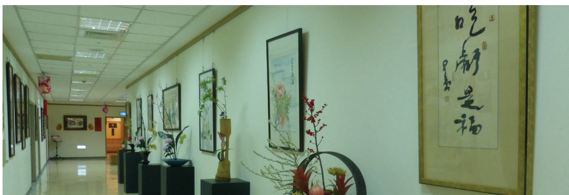
蘭陽別院 - 人間大學蘭陽分校